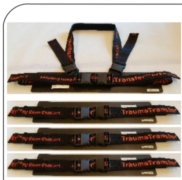
TTX Next Gen™ Krysskoppling 1+ 3 st SMART™ bälte